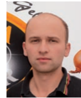
U. Himmelberger Winterthur

Montag bis Freitag: 08.00 bis 12.00 Uhr 13.30 bis 18.30 Uhr Samstag: 08.00 bis 16.00 Uhr durchgehend