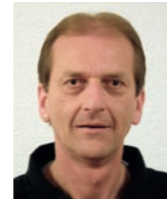
B. Vogelsanger Bachenbülach

Montag bis Freitag: 08.00 bis 18.30 Uhr durchgehend Samstag: 08.00 bis 17.00 Uhr durchgehend